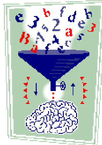
Opgave: ordenen en presenteren van ervaringen