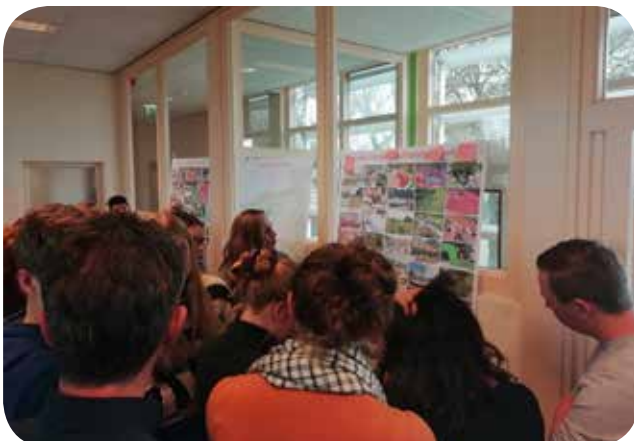
Leerlingen die mochten meedenken