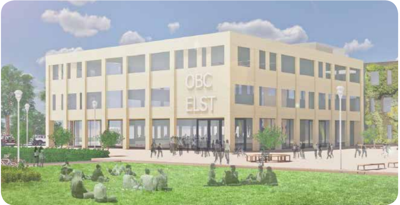
Een impressie van de nieuwe school

De volgende stap is de ontwikkeling van het technisch ontwerp en het 'uitvoeringsgereed' ontwerp. Dit houdt in dat het definitief ontwerp verder doorontwikkeld wordt, zodat alles voorbereid is voor de start van de bouw.