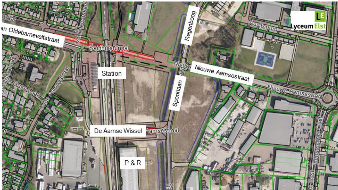
Het stationsgebied nu